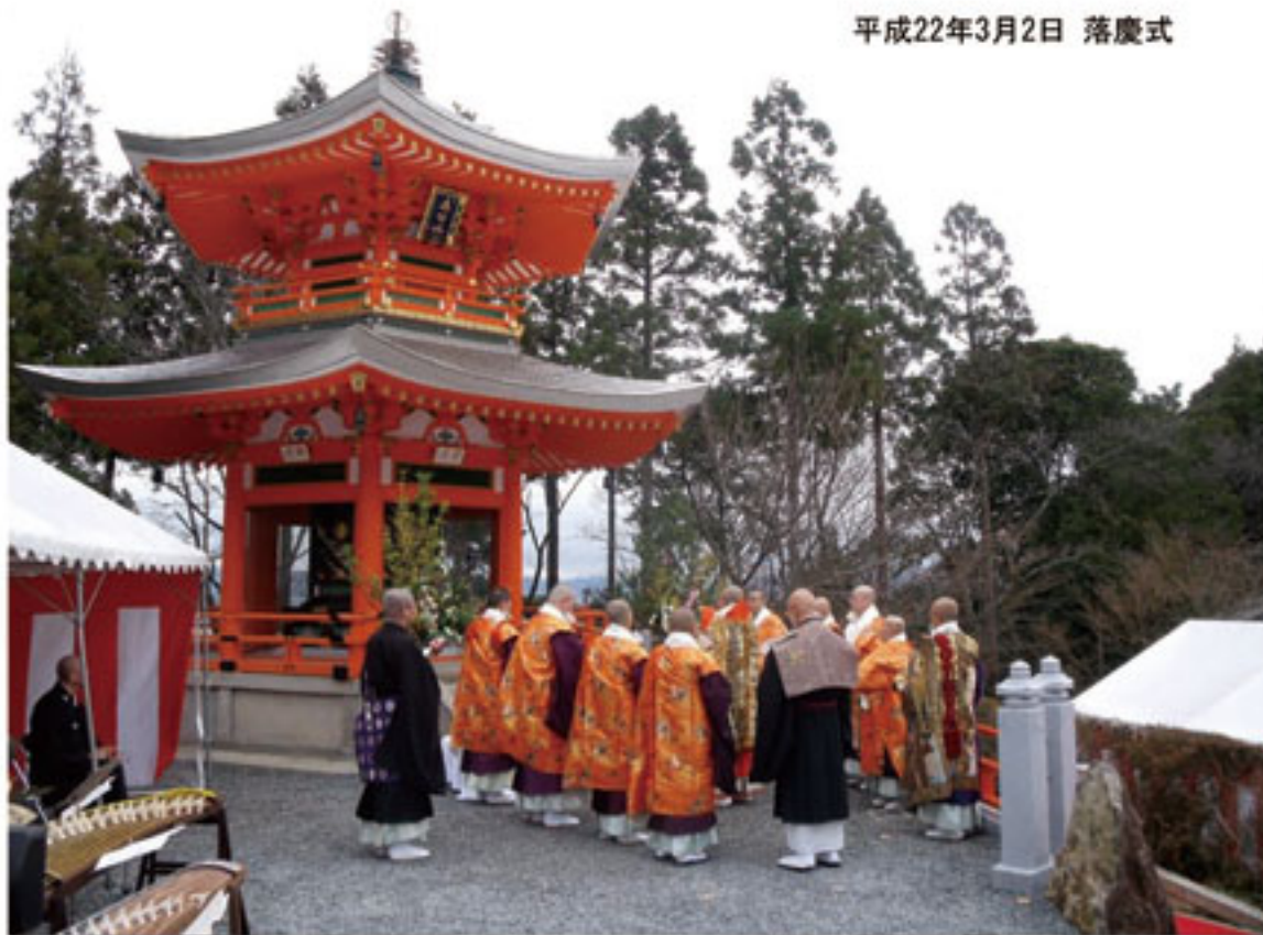
平成22年3月2日 落慶式

京都市高台寺六角堂(重要文化財)を平成15年より解体開始 洛西の名刹正法寺に移築、平成21年5月完成 施工(株)さわの道元 地下三方壁面には、「弥勒菩薩」と「曼荼羅一对」 及び天井に天女三体を(常温転写)トランスアート 施工(株)大木工藝