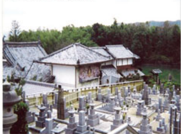
平成16年3月6日 常温転写施工