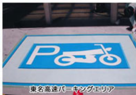
東名高速パーキングエリア