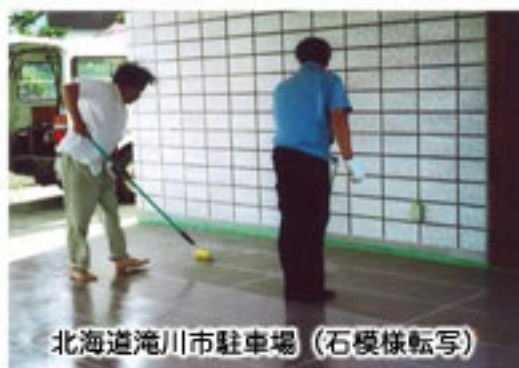
北海道滝川市駐車場 (石模様転写)