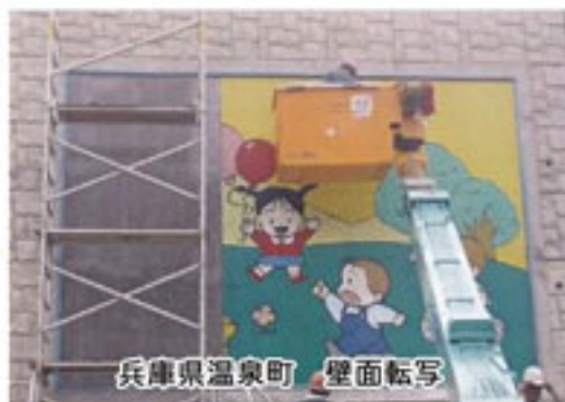
兵庫県温泉町 壁面転写