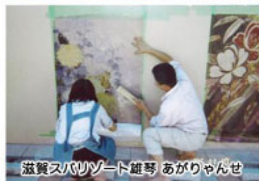
滋賀スパリゾート雄琴 あがりゃんせ