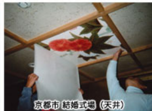
京都市 結婚式場 (天井)