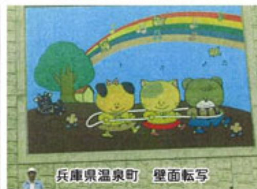
兵庫県温泉町 壁面転写