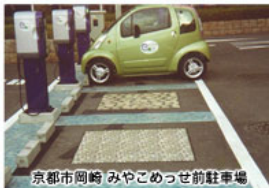
京都市岡崎 みやこめっせ前駐車場