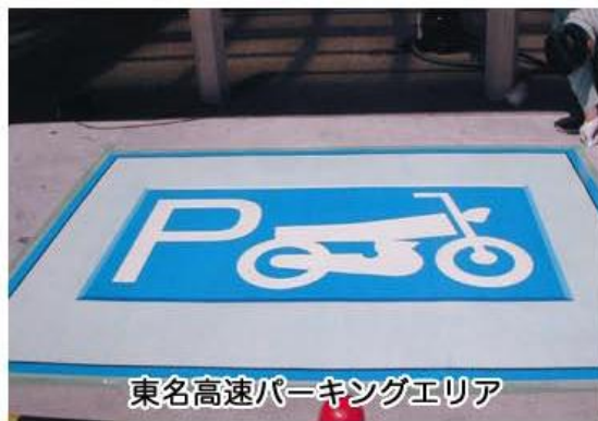
東名高速パーキングエリア