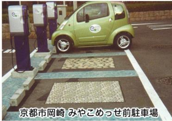
京都市岡崎 みやこめっせ前駐車場