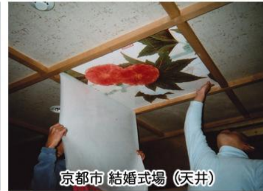
京都市 結婚式場 (天井)