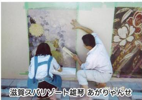
滋賀スパリゾート雄琴 あがりゃんせ