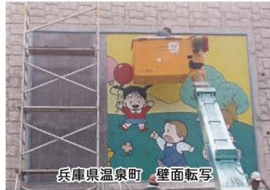
兵庫県温泉町 壁面転写