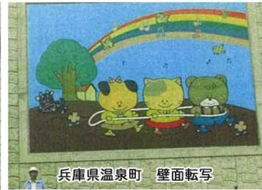
兵庫県温泉町 壁面転写