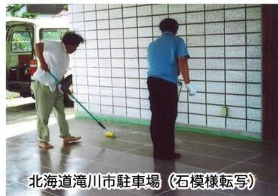
北海道滝川市駐車場 (石模様転写)