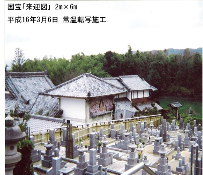
国宝「来迎図」 2m × 6m

株式会社 大木工藝殿 貴社が湯浅別荘山正寺の遊照塔 建立工事の際に卓越せる技術と最 大の誠意をももとの任務を遂行さ れました ここに落慶式を挙行するにあたり記 念品贈呈し深感謝の意を表ま す 平成二十二年三月二日 真言宗東寺派館長 大僧正 峰孝雄