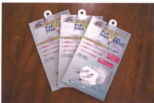
株式会社大木工藝ホームページ(外部サイト)