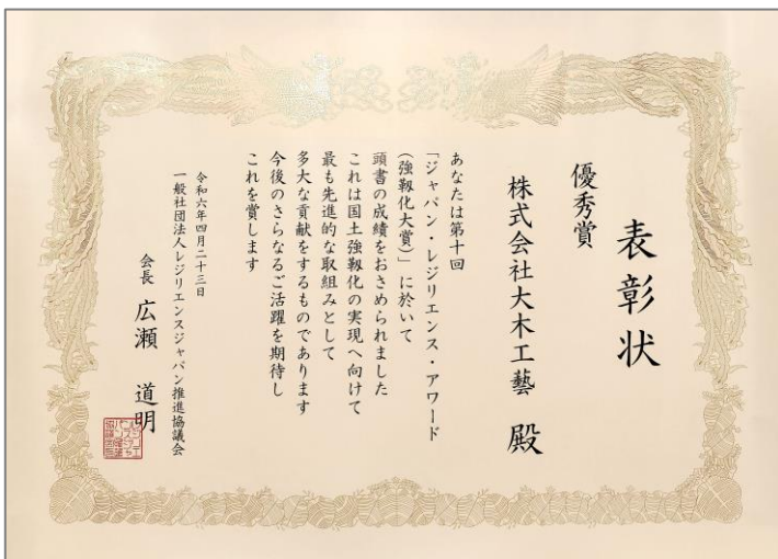
優秀賞 「炭素を使用した省エネ節電シートデコカーボ®」