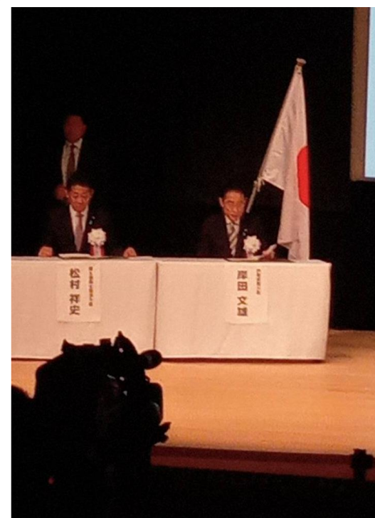
■ 岸田文雄内閣総理大臣と松村国土強靱化担当大臣