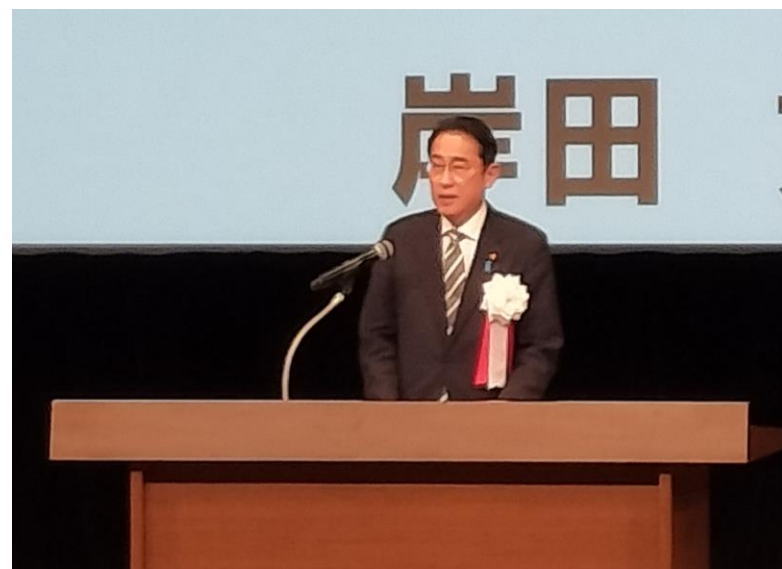
■ 内閣府広報室から岸田総理のスピーチが動画で掲載されております。 https://x.gd/PmfIP