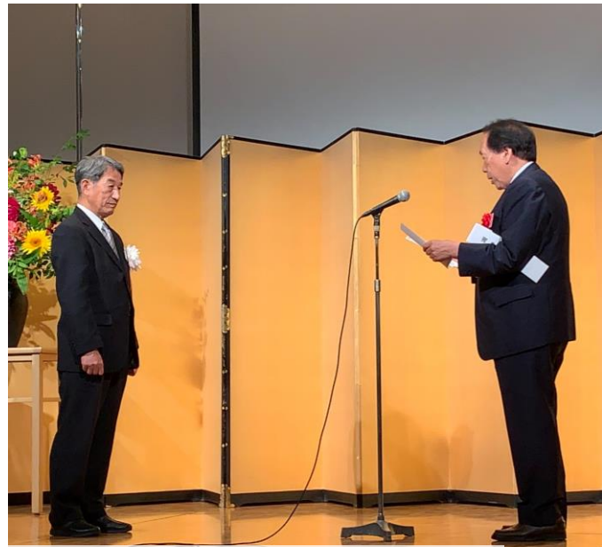
受賞企業を代表して謝辞を述べました。