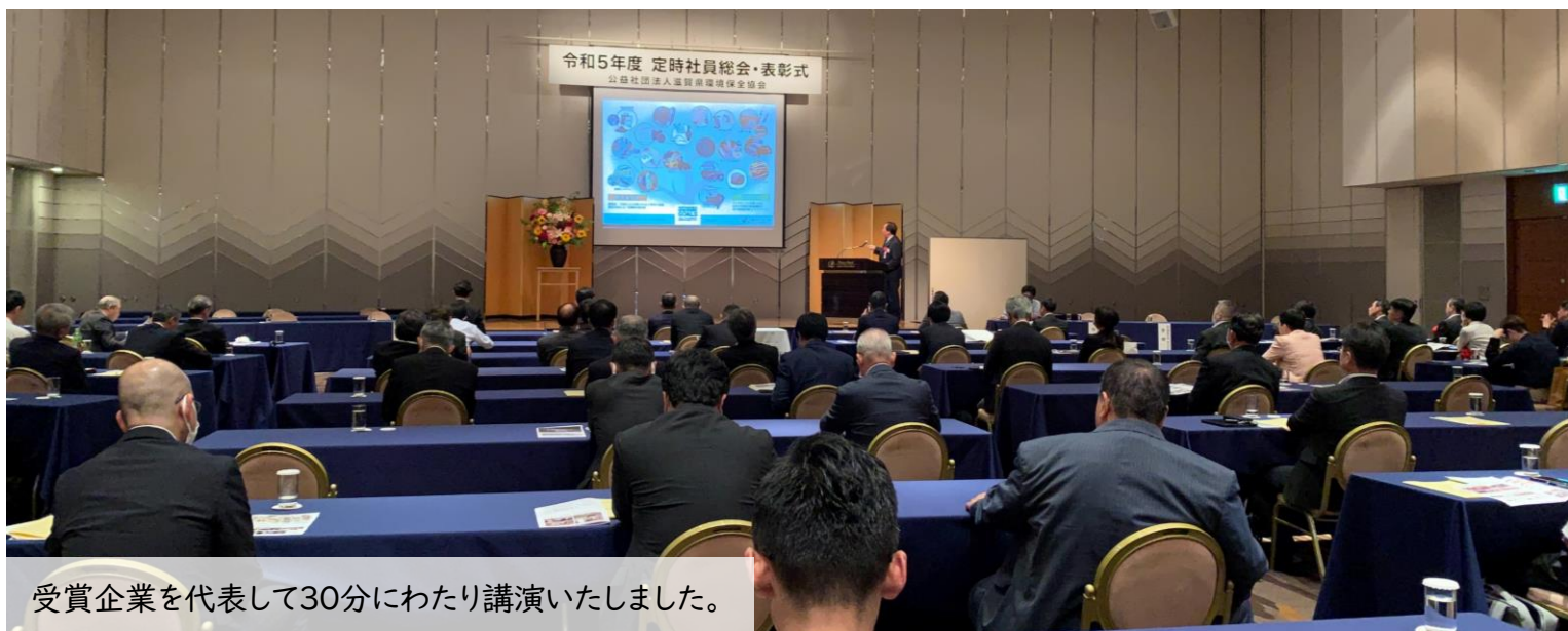
受賞企業を代表して30分にわたり講演いたしました。