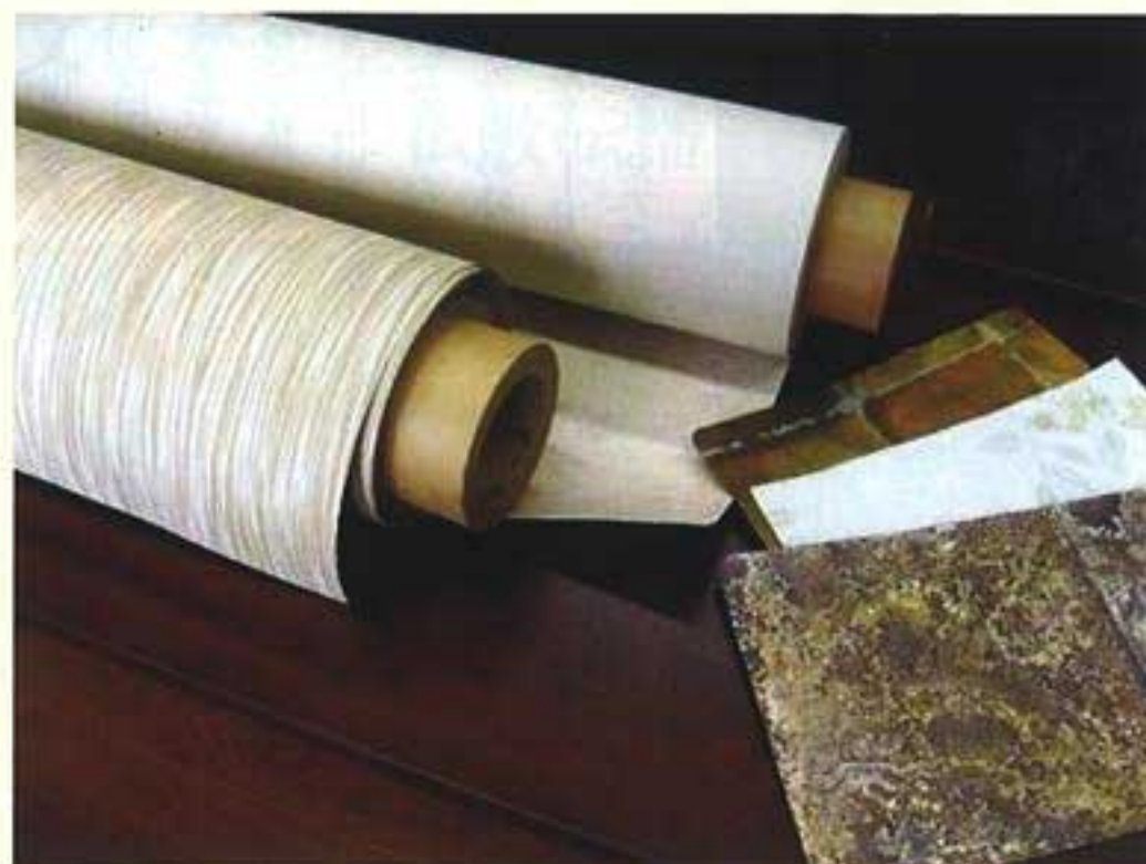
開発・商品化に成功した、初めて炭素シートを採用した壁紙

開発した壁紙は、断熱のみでなく新しく蓄熱というアイデアを加えたもの。さらにシックハウス症候群の原因物質であるホルムアルデヒドなどを吸着除去する竹炭を配合している。またこの壁紙は、四層構造(防災紙・竹炭混合蓄熱層・断熱性炭素シート層・表面クロス層)で、防災にも配慮しており、しなやかで施工性にも優れている。基本となる断熱・蓄熱層は、厚みが 0.3mm 程度で、表面クロスは用途・ニーズに応じて任意に選択できる。