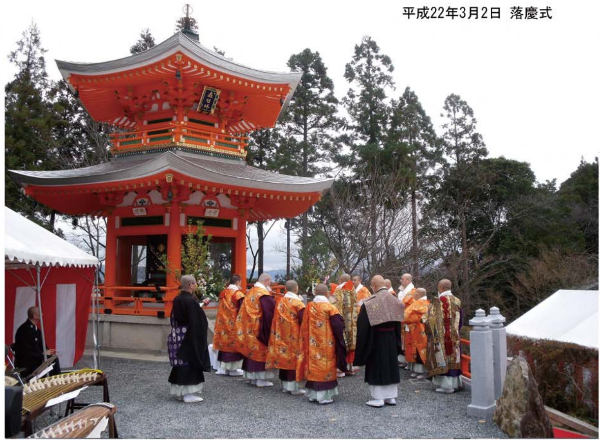
平成22年3月2日 落慶式

京都市高台寺六角堂(重要文化財)を平成15年より解体開始 洛西の名刹正法寺に移築、平成21年5月完成 施工(株)さわの道元 地下三方壁面には、「弥勒菩薩」と「曼荼羅一对」 及び天井に天女三体を(常温転写)トランスアート 施工(株)大木工藝